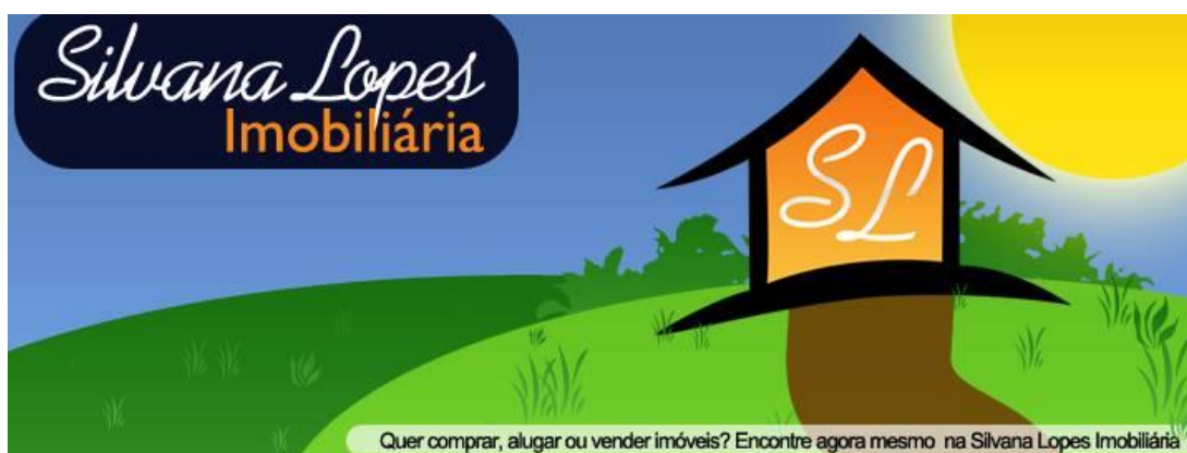
Figura 1. Capa Facebook

Foi criada a página no facebook para a Imobiliária, alimentando-o com postagens, anunciando dos imóveis a disposição de venda / locação a disposição do cliente. Seu período segue de quando abriu a empresa até os dias de hoje, suas postagens seguem durante a disponibilização do imóvel, podendo haver alterações em seu valor em seu ciclo de vida.