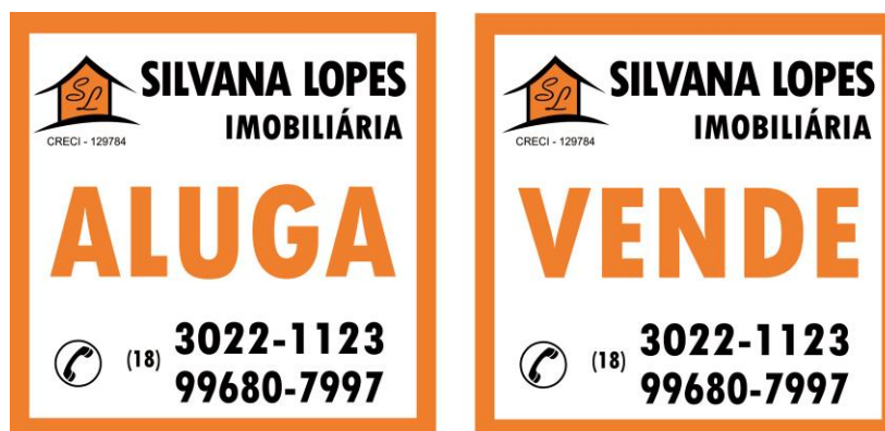
Figura 3. Placas para imóveis

Estima-se que com esses anúncios a proprietária pretende ter uma maior divulgação para seus imóveis e maior número de interessados nos imóveis, aumentando assim sua carteira de administração de imóveis em Assis tanto alugando ou vendendo.