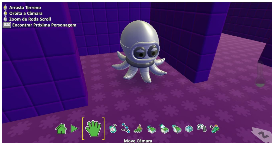
Figura 5 – Octopus

Todos os personagens estão pré-definidos. O personagem principal que é controlado pelo jogador, é o próprio Kodu. A partir da segunda fase aparecem obstáculos que objetivam deixar o jogo um pouco mais difícil. Os obstáculos são personagens conhecido como Octopus, apresentado na figura 5. Nesta fase, o Octopus é estático, porém nas demais fases ele se movimenta, e também dispara mísseis. O jogador recebe a opção de atirar, através da tecla espaço, para conseguir remover esse personagem do caminho e continuar.