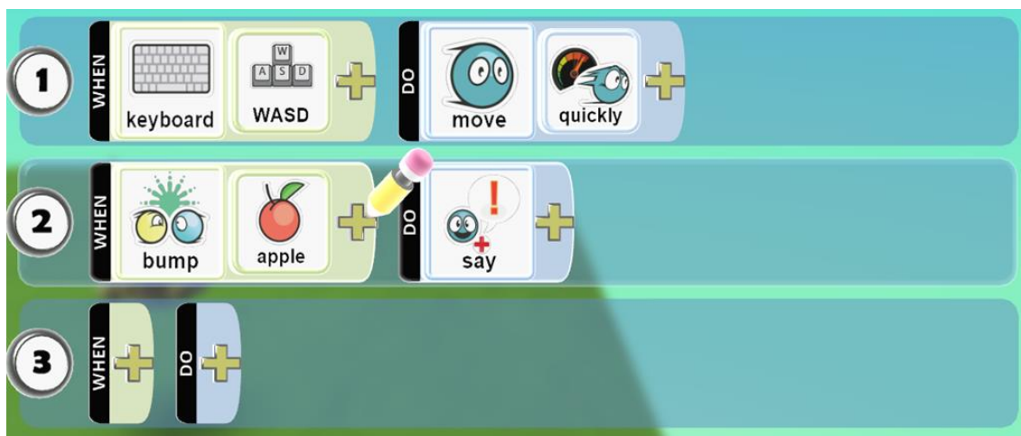
Figura 2 – Regras da linguagem Kodu

Para SHOKOUHI, ASEFI e SHEIKHI (2013) o Kodu torna a programação interessante e criativa, para o programador, ao invés de ter que escrever os códigos, é possível usar e criar os objetos. Cada personagem e objeto tem um conjunto específico de ações, comportamento e propriedade, reagindo a um conjunto de diferentes eventos (ver, bater, ouvir, mover, lançar, entre outros). O Kodu especifica condições, sequências e normas, que ensinam causa e efeito. Embora a linguagem do Kodu seja diferente das demais linguagens de programação, ela permite que os usuários explorem vários conceitos fundamentais da ciência da computação, como: estrutura de repetição, condições e ações, lógica de programação, identificação e correção de erros. A tabela 1 apresenta a correspondência entre estruturas utilizadas pelo Kodu e a estrutura de programação ensinada em cursos da área de computação.