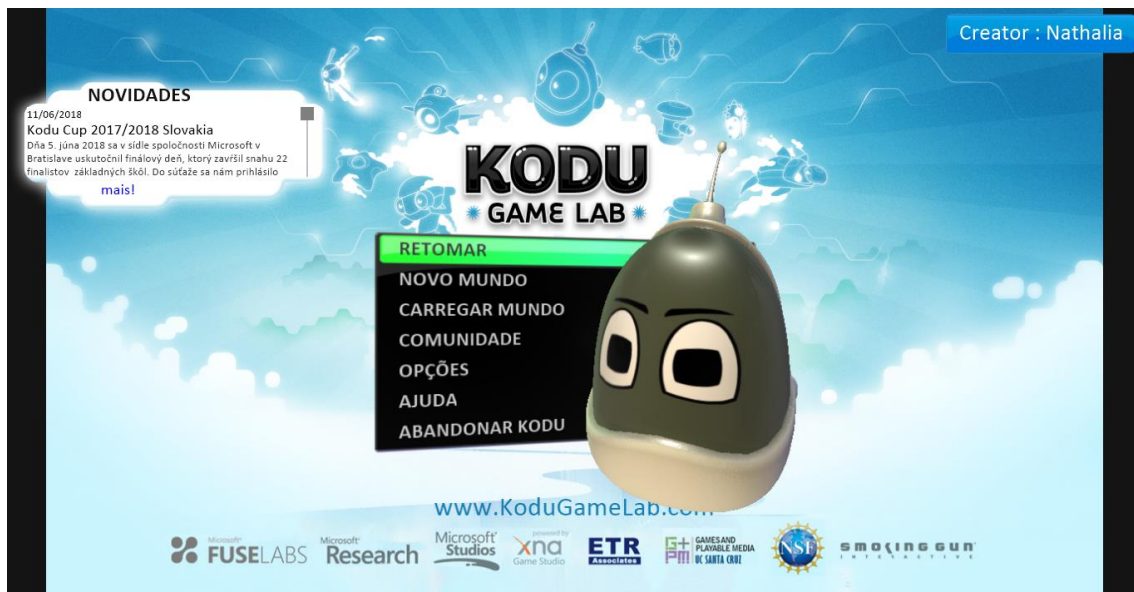
Figura 1 – Tela Inicial Kodu

Atualmente o Kodu consiste em mais de 500 blocos de regras. A gramática básica descrita por STOLEE (2010) é a seguinte: