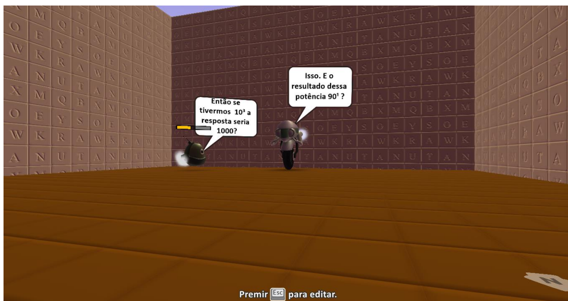
Figura 4 – Personagens interagindo

De acordo com a figura 3, a área representada por A, ilustra o início do jogo, nesse primeiro momento o jogador não pode movimentar-se, pois é apresentada uma ‘história’, onde o personagem recebe instruções sobre o jogo e também sobre o tema. O ponto B, representa a entrada para o labirinto, e aqui o jogador pode movimentar o personagem através das teclas WASD. A saída do labirinto é o ponto C. Quando o jogador chega nesse ponto, ele também não consegue se movimentar, até acabar outra história. A área ilustrada em D, é uma dica e exemplo para o jogador entender mais sobre o tema proposto, ao fim da história é entregue uma maçã, que ao comer o Kodu passa de fase. A figura 4 representa uma história, onde os personagens interagem.