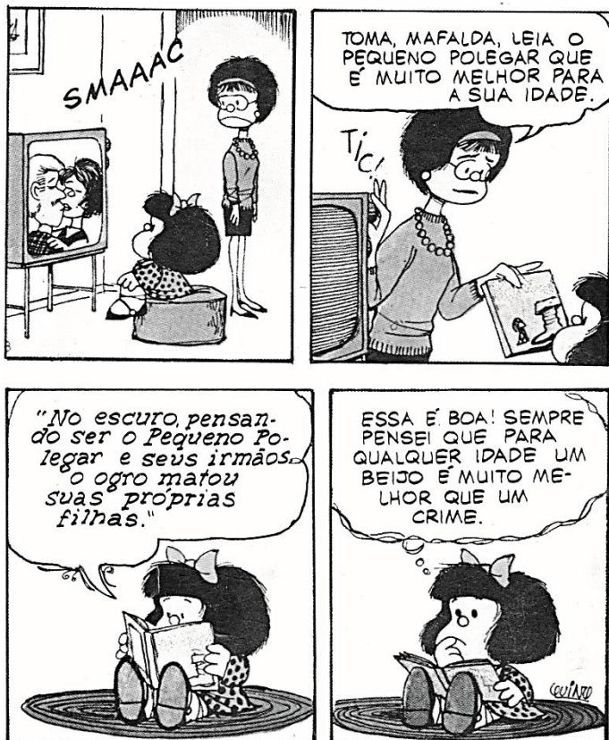
(QUINO . Mafalda 3. São Paulo: Martins Fontes, 1998)

Instrução: Observe a tira a seguir e responda às questões 07 e 08.